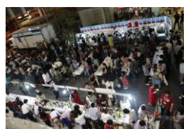
EAT WINE!! TOYAMA 2014