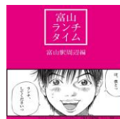
とやま ランチ TIME vol.4表紙

「とやま ランチ TIME vol.4」を新たに発行した。観光客やコンベンション参加者などへのおもてなしの向上と、昼食時間帯の中心商店街、富山駅周辺の活性化及び賑わい創出を図ることを目標としている。また、「シティーウォーカー第15号」を3月下旬に発行（60,000部）した。今版は3月14日の北陸新幹線開業に合わせて、外国人観光客の増加を見据えた外国語対応を行い、内容の一層の充実に向けている。