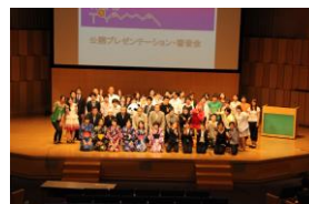
公開プレゼンテーションにて集合写真