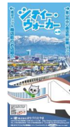
シティーウォーカー vol.15表紙