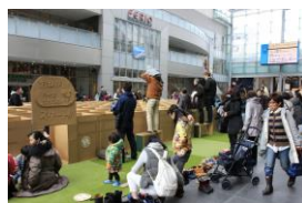
【自主企画イベント】ダンボール迷路 (2/10~3/5)